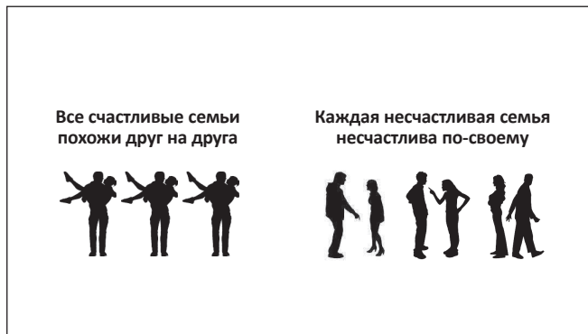
Рис. 2. Изображения счастливых и несчастных пар подчёркивают толстовскую мысль.

выразительность. Если бы мы смогли собрать две группы людей, говорящих по-русски, но в силу каких-то причин никогда не слышавших начальных строк «Анны Карениной», и показали группе А первый слайд (с оригинальной фразой), а группе Б – второй (с картинками), то, я уверен, такое исследование обнаружило бы: респонденты из группы Б на какие-то доли секунды быстрее понимают, о чём идёт речь. Так происходит потому,