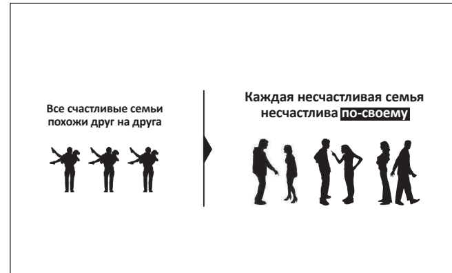
Рис. 8. Стрелка отражает новый поворот мысли: несчастливые семьи не берутся из ниоткуда, что-то начинает происходить со счастливыми парами.

Мы адаптируемся к новой среде. Точно так же к ней адаптируются и тексты. Литера-