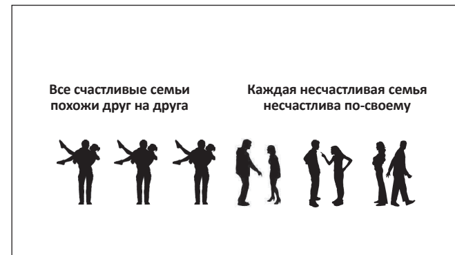
Рис. 4. Ещё одна бессмыслица.