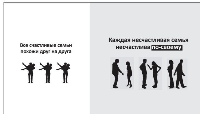
Рис. 7. После добавления второго фоновой цвета композиция стала чётче. Серая часть больше белой – в полном соответствии с размерами кегля и картинок.