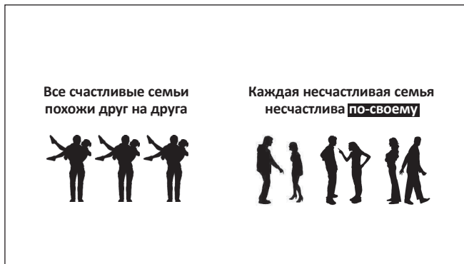
Рис. 5. Выделив всего одно слово, мы даём понять: речь пойдёт о том, что у разных пар – разные проблемы.

можем это подчеркнуть: например, выделить наречие «по-своему» (рис. 5) и даже уменьшить размеры левой части слайда (рис. 6). Правда, в получившейся композиции есть какая-то неловкость: она как будто хромотает на одну ногу. Чтобы уравновесить слайд, обозначим границы его правой части – более важной и потому занимающей больше пространства – фоном. Вот сейчас, кажется, всё встало на свои места (рис. 7). Теперь понятно: левая часть – только